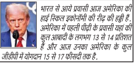
भारत से आये प्रवासी आज अमेरिका की हार्ड रिकल इकोनॉमी की रीढ़ की हड्डी हैं. अमेरिका में पहली पीढ़ी के प्रवासी यहां की कुल आबादी के लगभग 13 से 14 प्रतिशत हैं और आज उनका अमेरिका के कुल जीडीपी में योगदान 15 से 17 फीसदी तक है.

'पल में तोला, पल में माशा' स्वाभाव वाले अमेरिकी राष्ट्रपति डोनाल्ड ट्रंप एक ही सांस में भारत को महान देश भी बताते हैं और प्रधानमंत्री मोदी को अपना सबसे अच्छा दोस्त भी कहते हैं. लेकिन उसी सांस में यह कहते भी नहीं झिझकते कि भारत और चीन अमेरिका के लिए 'नर्क का द्वार' हैं. ट्रंप ने कट्टरधर्मी अमेरिकी लेखक और रेडियो होस्ट माइकल सेवेज की उस पुराने को शेर कर दिया, जिसमें सेवेज ने भारत और चीन को 'हेल हेल' (नर्क का द्वार) बताया है. जिसमें मूलतः यह लिखा गया है कि जन्म के आधार पर अमेरिका में बच्चों को जो नागरिकता मिलती है, उसका भारत और चीन फायदा उठाते हैं और गर्भावस्था के समय में अमेरिका आकर बच्चों को जन्म देते हैं ताकि उन्हें तुरंत नागरिकता मिल जाए. ट्रंप की यह पोस्ट अपने किस्म का नरसवाद है, जो भावनाएं भड़काने का काम कर रही है. महारड से देखा जाए तो जो अमेरिका कुछ घटतीभर प्रवासियों के चलते भारत को अपमानित करने की कोशिश कर रहा है, वही भारतीय आज की तारीख में अमेरिका की आर्थिक रीढ़ की हड्डी हैं. सिलिकॉन वैली से लेकर वॉल स्ट्रीट तक यह भारतीय ही हैं, जो आधुनिक टेक इंडस्ट्री को नेतृत्व प्रदान कर रहे हैं. सुदूर पिछाई और सत्या नडेला भी