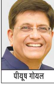
भारत-न्यूज़ीलैंड मुक्त व्यापार समझौता (एफटीए), जिस पर सोमवार को हस्ताक्षर किये जायेंगे, विकसित दुनिया के साथ भारत की सहभागिता में एक महत्वपूर्ण मील का पत्थर है. यह वैश्विक आर्थिक साझेदारियों को किसानों, महिलाओं, युवाओं और रोजगार सृजक उद्योगों के लिए ठोस लाभ में बदलने से जुड़े प्रधानमंत्री नरेन्द्र मोदी के दृष्टिकोण में हुई निर्णायक प्रगति को प्रतिबिंबित करता है. यह एफटीए प्रमुख विकसित अर्थव्यवस्थाओं, जिसमें यूनाइटेड किंगडम और यूरोपीय संघ शामिल हैं, के साथ हुए कई ऐतिहासिक व्यापार समझौतों के बाद हो रहा है. ये समझौते वैश्विक बाजारों में भारत की स्थिति को मजबूत करते हैं और निर्यातकों को दुनिया की कुछ सबसे लाभकारी अर्थव्यवस्थाओं में, यहां तक कि वर्तमान वैश्विक अनिश्चितता और उथल-पुथल के बीच भी, प्रतिस्पर्धा आधारित बढ़त प्रदान करते हैं. निर्यात और रोजगार को मजबूत बढ़ावा दोनों पक्षों के लिए समान रूप से लाभकारी इस समझौते के केंद्र में न्यूज़ीलैंड

आज भारत ताकत और विश्वसनीयता की स्थिति के साथ वाता करता है. पहले के दशकों में व्यापार समझौतों को अक्सर संवेदनशील क्षेत्रों को अपर्याप्त सुरक्षा दिए बिना अंतिम रूप दिया जाता था, इसके विपरीत वर्तमान वार्ताएं सुनिश्चित करती हैं कि कृषि, डेयरी और अन्य संवेदनशील क्षेत्र पूरी तरह से सुरक्षित रहें. जैसे-जैसे भारत विकसित अर्थव्यवस्थाओं के साथ अपनी सहभागिता को प्रगाढ़ कर रहा है, विकसित दुनिया के साथ हुए व्यापार समझौते इस तथ्य का सशक्त उदाहरण प्रस्तुत करते हैं कि व्यापार नीति को कैसे राष्ट्रीय विकास लक्ष्यों के साथ संरेखित किया जा सकता है, जिससे विकसित भारत 2047 का लक्ष्य हासिल करने की दिशा में समावेशी वृद्धि और दीर्घवधि आर्थिक सुदृढ़ता सुनिश्चित होती है.