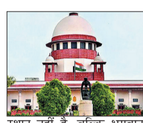
स्थान नहीं है, बल्कि भगवान अयप्पा के ब्रह्मचारी स्वरूप का

चौथे दिन की बहस में मंदिर प्रबंधन का पक्ष रखने वाले त्रावणकोर देवस्वोम बोर्ड ने कहा कि यह कोई सामान्य सार्वजनिक