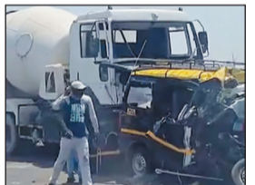
महाराष्ट्र, गुजरात और यूपी में दुर्घटनाएं

नई दिल्ली, 13 अप्रैल. रविवार-सोमवार की रात तीन अलग-अलग हादसों में 24 लोगों की मौत हो गई और 13 लोग घायल हो गए. ये हादसे महाराष्ट्र, गुजरात और यूपी में हुए.