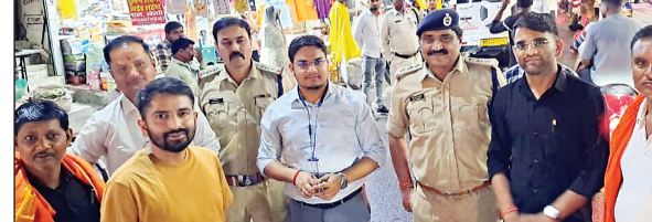
आज श्री हनुमान जन्मोत्सव पर जगह-जगह हवन पूजन के साथ शोभायात्रा निकाली जाएगी