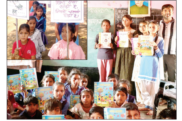
कुम्हारी नवभारत 1 अप्रैल। संकुल कुम्हारी से जुड़ी शालाओं में प्रवेश उत्सव मनाया गया। इस दौरान नवप्रवेशित छात्रों का तिलक लगाकर पुष्प वर्षा कर विद्यालय में स्वागत किया गया।

संकुल कुम्हारी से जुड़ी शालाओं में प्रवेश उत्सव मनाया गया