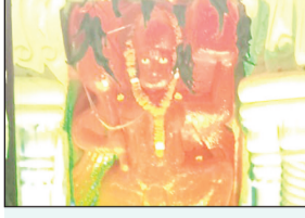
हनुमान जन्मोत्सव पर अखंड राम धुन

33वें हनुमान जन्मोत्सव पर अखंड राम धुन 72 घंटे की हनुमान मंदिर गुंजी तिगडा पर चल रही है. जिसमें आज हवन भंडारा का आयोजन आयोजक पवन उपाध्याय गुंजी तिगडा द्वारा किया जा रहा है.