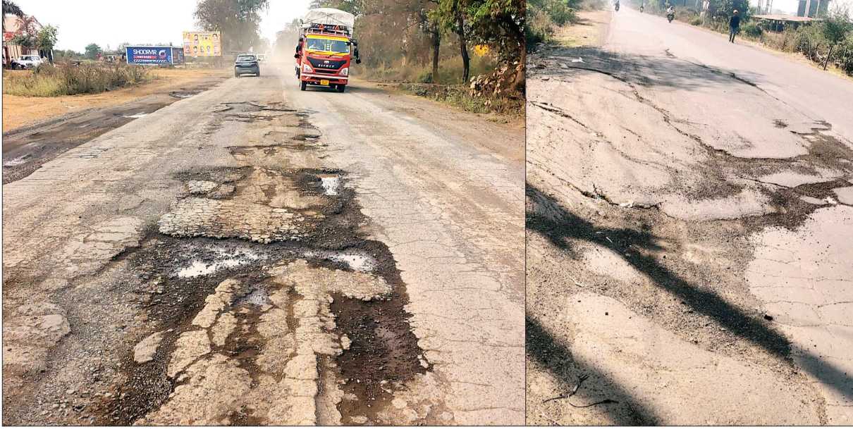
13 मील स्थल के नजदीक सड़क की दुर्घटना बयां करता