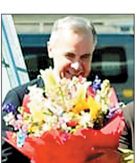
2 मार्च को पीएम मोदी से मिलेंगे कार्नी

प्रधानमंत्री के तौर पर मार्क कार्नी का यह पहला भारत दौरा है. कनाडा में निवेश को बढ़ावा देने के लिए कार्नी मुंबई में बिजनेस लीडर्स से मुलाकात करेंगे. इस दौरान इंफ्रास्ट्रक्चर,