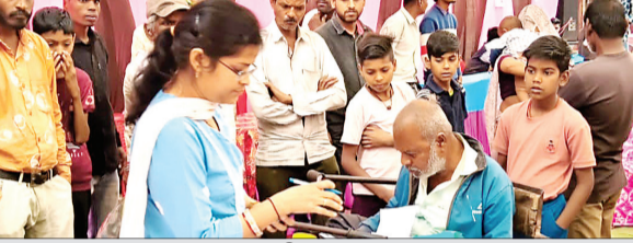
पात्र हितग्राही हुए लाभान्वित