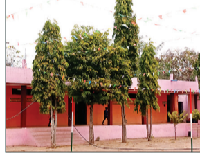
यहां भी शुरू हुई परीक्षाएं

रूप में विकसित किया गया है. इन परीक्षा केंद्रों पर परीक्षार्थियों का पूर्णतः स्वगत कर सकारात्मक और उत्साहपूर्ण वातावरण तैयार किया गया। विद्यार्थियों को तनावमुक्त माहौल प्रदान करने के लिए केंद्रों पर विशेष व्यवस्थाएं की गई हैं। परीक्षा के पहले दिन विद्यार्थी उत्साहपूर्वक परीक्षा में सम्मिलित हुए।