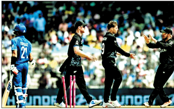
को दो झटके दिये. इसके बाद ग्लेन फिलिप्स ने टिम साइफर्ट के साथ पारी को संभाला. दोनों बल्लेबाजों के बीच तीसरे विकेट के लिए 74 रनों की साझेदारी हुई.

चेन्नई, 08 फरवरी. टिम साइफर्ट (65) और ग्लेन फिलिप्स (42) की शानदार बल्लेबाजी की बदौलत न्यूजीलैंड ने रविवार को टी-20 विश्वकप 2026 के चौथे मुकाबले में अफगानिस्तान को पांच विकेट से हरा दिया.