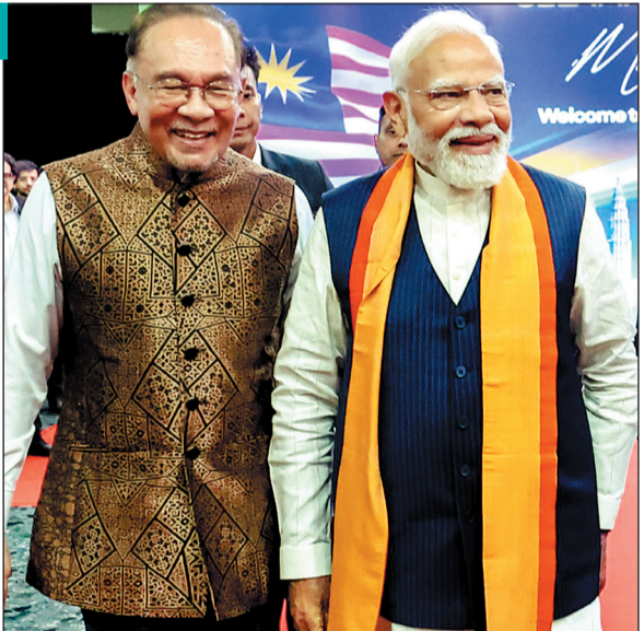
मुलाकात के दौरान दोनों नेताओं के बीच दिखे गहरे संबंध

पीएम मोदी ने भारतीय समुदाय के लोगों से कहा कि आपने रोटी चनाई को मलाबार परोट्टा से जोड़ा है. नारियल, मसाले और चाय भी हमारे रिश्ते को जोड़ते हैं. चाहे कुआलालंपुर हो या कोच्चि, स्वाद एक जैसे लगते हैं. हम एक-दूसरे को अच्छी तरह समझते हैं, शायद इसलिए क्योंकि हमारी भाषाओं और मूल्य भाषा में कई शब्द समान हैं. भारतीय पीएम ने कहा कि यह जानकर खुशी होती है कि प्रधानमंत्री अनवर इब्राहिम को महान अभिनेता और नेता