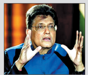
समझौता मेक इन इंडिया को करेगा मजबूत: पीएम

नई दिल्ली, 07 फरवरी. भारत पर अमेरिकी अतिरिक्त टैरिफ शनिवार से पूरी तरह समाप्त हो गया है. कॉर्प्स और उद्योग मंत्री पियूष गोयल ने शनिवार को प्रेस कॉन्फ्रेंस में बताया कि भारत-अमेरिका अंतरिम व्यापार समझौते के तहत अब भारतीय कृषि और अन्य प्रमुख उत्पाद अमेरिका में जीरो ड्यूटी पर निर्यात किए जाएंगे. इसके परिणामस्वरूप किसानों, मछुआरों और एमएसएमई सेक्टर को प्रत्यक्ष लाभ मिलेगा.