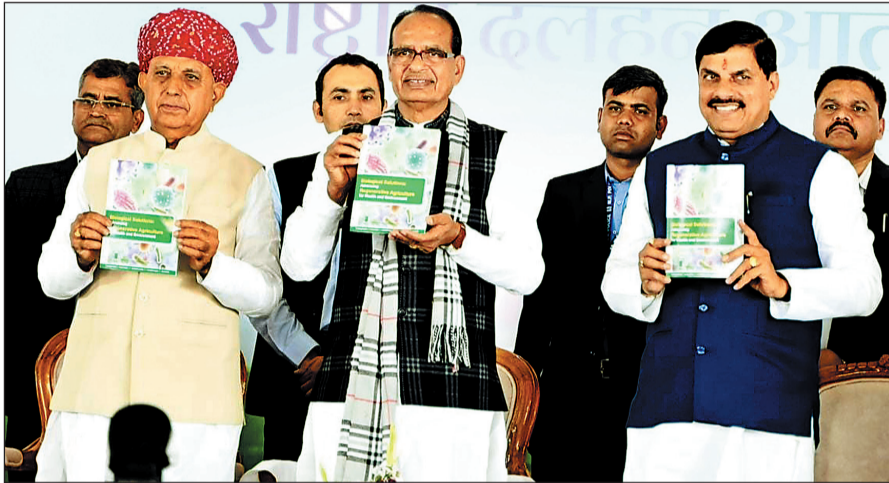
दलहन-तिलहन मिशन में अग्रणी कार्य करेंगे: मुख्यमंत्री

राष्ट्रीय सम्मेलन को संबोधित करते हुए केंद्रीय कृषि मंत्री चौहान ने कहा कि प्रधानमंत्री ने 27 देशों के साथ समझौते किए, लेकिन किसानों के हितों से समझौता नहीं होने दिया. अब लक्ष्य है कि देश में दालों का उत्पादन बढ़ाया जाए. उन्होंने फसल विविधीकरण पर जोर देते