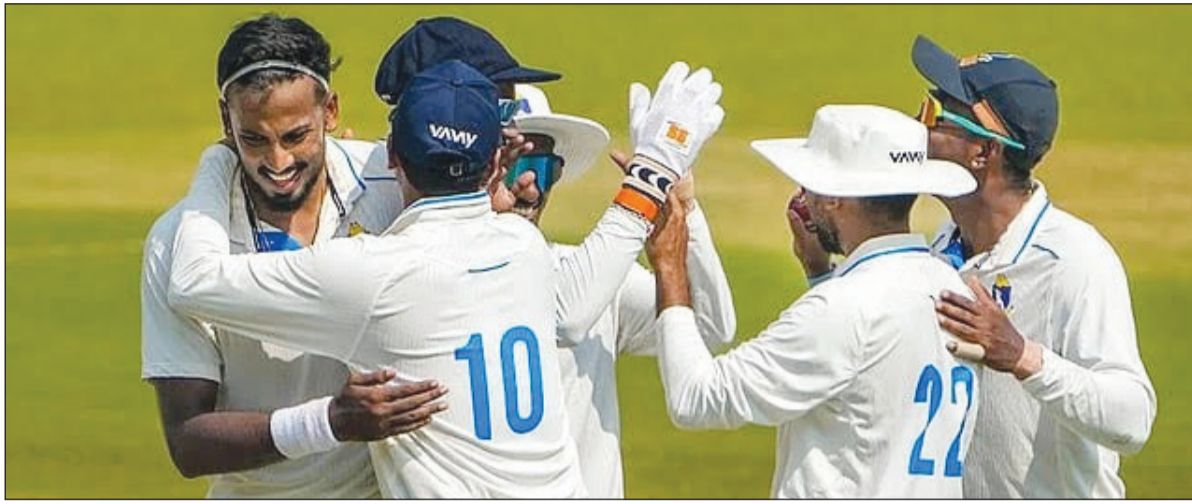
रणजी ट्रॉफी 2025-26 सातवें राउंड के पहले दिन हाई-वोल्टेज मुकाबले