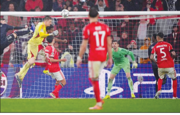
गोलकीपर अनातोली टुबिन ने 98वें मिनट में हेडर से गोल दागकर अपनी टीम को जीत दिलाई और साथ ही रियल मैड्रिड को सोधे अंतिम-16 में पहुंचने से रोक दिया। स्टेडियम ऑफ लाइट, लिस्बन में खेले गए इस मुकाबले में आखिरी सेकंड तक तस्वीर

लिस्बन, 29 जनवरी। यूईएफए चैंपियंस लीग 2025-26 में बुधवार रात खेले गए मुकाबले में बेनफिका ने फुटबॉल इतिहास के 9 खिलाड़ियों के साथ खतम हुआ रियल का मुकाबला एम्बापे के दो गोल भी नहीं बचा सके मैड्रिड को