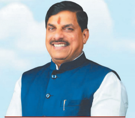
डॉ. मोहन यादव मुख्यमंत्री