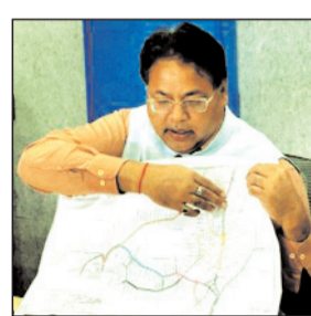
रेल लाइन परियोजनाओं को केंद्रीय मंत्री मण्डल ने स्वीकृति प्रदान की है और भुज-नलिया रेल लाइन का वायोर तक विस्तार एवं नलिया-जखाऊ पोर्ट नई रेल लाइन लगभग 194 किमी रुपये 3375 करोड़ की लागत से बनाई जायेगी. सीमावर्ती एवं तटीय क्षेत्रों में रेल संपर्क को सुदृढ़ करने, औद्योगिक विकास को प्रोत्साहन देने तथा सामरिक दृष्टि से महत्वपूर्ण अवसंरचना को सशक्त करने की दिशा में एक महत्वपूर्ण कदम सिद्ध होगी. - नलिया-जखाऊ पोर्ट (24.88 किमी) नई ब्रॉडगेज रेल लाइन, यह रेल लाइन भुज-नलिया खंड के नलिया स्टेशन से प्रारंभ होकर जखाऊ बंदरगाह तक जाएगी.