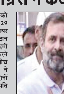
इसके बाद यह सफ हो गया कि इस बार भी विपक्ष साझा रणनीति के साथ चुनाव मैदान में उतरेगा. मंगलवार को चंडीगढ़ स्थित कांग्रेस कार्यालय में कांग्रेस और आम के गठबंधन का औपचारिक एलान किया.

चंडीगढ़. चंडीगढ़ में मेयर चुनाव को लेकर सरगर्मियां तेज हो गई हैं. 29 जनवरी को मेयर, सीनियर डिप्टी मेयर और डिप्टी मेयर के पदों के लिए मतदान होगा. बीजेपी, कांग्रेस और आम आदमी पार्टी अपनी-अपनी जीत सुनिश्चित करने के लिए रणनीति बना रही हैं. इसी बीच कांग्रेस और आम आदमी पार्टी ने गठबंधन करने का फैसला किया है. दोनों दलों ने मिलकर चुनाव लड़ने पर सहमति जता दी है. बताया जा रहा है कि कांग्रेस और कक के बीच पिछले कई दिनों से गठबंधन को लेकर बातचीत चल रही थी. हालांकि दोनों पक्षों के कुछ नेता इस साझेदारी को लेकर असहज थे. बाद में कांग्रेस सांसद मनीष तिवारी की मध्यस्थता से दोनों दलों में सहमति बन गई.