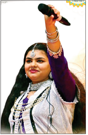
कीर्तन, शाम 4 बजे निरंजनी महोत्सव, शाम 7 बजे महाआरती तथा रात्रि 8 बजे सांस्कृतिक

अनूपपुर, नवभारत 21 जनवरी। जिले की नर्मदा उद्गम नगरी अमरकंटक में मां नर्मदा की जयंती के अवसर पर दो दिवसीय नर्मदा महोत्सव-2026 का आयोजन 24 एवं 25 जनवरी को किया जाएगा। संस्कृति सलिला मां नर्मदा की पावन उद्गम स्थली अमरकंटक में आयोजित यह महोत्सव धार्मिक, सांस्कृतिक और आध्यात्मिक गतिविधियों से ओतप्रोत रहेगा। महोत्सव के प्रथम दिवस 24 जनवरी को प्रातः 11 बजे मां नर्मदा शोभायात्रा, दोपहर 1 बजे अखण्ड