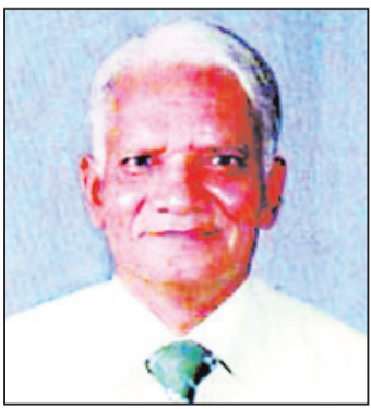
हाशमी सर का