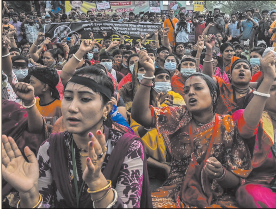
पाकिस्तान की एजेंसियों द्वारा बांग्लादेश को एक वैकल्पिक रणनीतिक आधार के रूप में उपयोग करने की कोशिशें क्षेत्रीय सुरक्षा के लिए भी खतरा हैं। इससे भारत-बांग्लादेश संबंध, सीमा सुरक्षा और दक्षिण एशिया की स्थिरता पर सीधा प्रभाव पड़ सकता है। यदि कट्टरपंथी राजनीतिक संरक्षण मिला तो बांग्लादेश की धर्मनिरपेक्ष पहचान कमजोर पड़ेगी और अल्पसंख्यकों का पलायन बढ़ सकता है। बांग्लादेश में वर्तमान हालात इतने खराब हैं की आने वाले वर्षों में यहां हिंदू आबादी बेहद कम हो जाएगी या समाप्त भी हो सकती है।

बांग्लादेश के निर्माता शेख मुजीबुर्रहमान इसे एक आधुनिक, लोकतांत्रिक और धर्मनिरपेक्ष राष्ट्र बनाना चाहते थे। 1971 में जब पूर्वी पाकिस्तान से अलग होकर बांग्लादेश अस्तित्व में आया था, तब यहां हिंदू समुदाय को आबादी लगभग बीस फीसदी से अधिक थी। यह संख्या आज घटकर नौ फीसदी के आसपास सिमट चुकी है। यह गिरावट आकस्मिक नहीं, बल्कि लगातार जारी सामाजिक-राजनीतिक दबाव, हिंसा, कट्टरवाद, कानूनी विभंगतियों और भय के सम्मिलित प्रभाव का परिणाम है। यदि हिन्दूओं पर होने वाले उत्पीड़न को नहीं रोका गया आने वाले दशकों में बांग्लादेश में हिंदू समुदाय का अस्तित्व इतिहास के पन्नों तक सीमित रह जाएगा। बीते कुछ दशकों में बांग्लादेश में इस्लामी कट्टरपंथी विचारधारा का प्रभाव गहरा हुआ है। जमात-ए-इस्लामी जैसे संगठन, जिनकी वैचारिक जड़ें पाकिस्तान समर्थक राजनीति से जुड़ी रही हैं, समाज में एक ऐसी कठोर धार्मिक सोच को विस्तार दे रहे हैं जो बहुलता, सहिष्णुता और विविधता के विरुद्ध खड़ी है। यह वही संगठन है जिसने अफगानिस्तान में तालिबान के कब्जे के बाद बांग्लादेश बनेगा अफगानिस्तान जैसे नारे गढ़कर युवाओं को कट्टरता की ओर उकसाने का प्रयास किया। इसी विचारधारा के परिणामस्वरूप ईशान्दि के नाम पर हिंसा, अल्पसंख्यकों को निशाना बनाना, धार्मिक स्थलों पर हमले और सामाजिक तनाव की घटनाएं बार-बार सामने आती रही हैं। विभिन्न अवसरों पर दुर्गा पूजा जैसे बड़े उत्सवों के दौरान मंदिरों और पंडालों को निशाना बनाया गया, मूर्तियों को तोड़ा गया और भय का वातावरण पैदा किया गया। कई घटनाओं में पुलिस की निष्क्रियता और प्रशासन के देर से हस्तक्षेप ने हालात को और बिगाड़ा है।