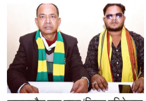
लखनादौन तक उदर/लिफ्ट एरिक्शन अथवा नहर प्रणाली से सतत जल आपूर्ति सुनिश्चित करने की माँग की है, ताकि पेयजल एवं सिंचाई संकट का स्थायी समाधान हो सके। साथ ही किसानों व मजदूरों के लिए सिंचाई, बीज, उर्वरक तथा बाजार से जुड़ी एक समग्र कृषि कार्ययोजना बनाने की

नवभारत, जबलपुर। लखनादौन एवं घंसीर विधानसभा क्षेत्र के नागरिकों, जनप्रतिनिधियों और सामाजिक संगठनों ने जल आपूर्ति, कृषि-पशुधन विकास, खेल सुविधाओं के विस्तार, लखनादौन को जिला घोषित करने, उचित परिसीमन निर्धारण सहित पाँच प्रमुख मांगों को लेकर एक ज्ञापन अनुविभागीय अधिकारी (राजस्व) लखनादौन के माध्यम से भारत सरकार के रेल मंत्री, मध्यप्रदेश शासन के खेल मंत्री, जल संसाधन मंत्री, मुख्यमंत्री, परिसीमन आयोग तक प्रेषित किया है। जनप्रतिनिधियों ने बरगी बांध से