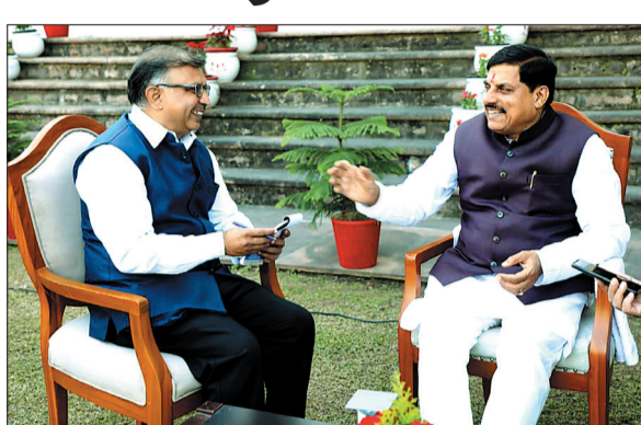
मुख्यमंत्री डॉ. मोहन यादव के साथ नवभारत के समाचार संपादक की विशेष चर्चा.