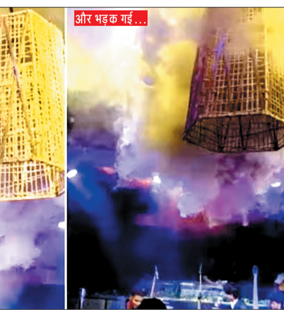
और भड़क गई...

पहुंचने में देरी हुई। गोवा के मुख्यमंत्री प्रमोद सावंत ने मजिस्ट्रियल जांच के आदेश दे दिए हैं और सभी क्लबों का सेफ्टी ऑडिट कराने की बात कही है।