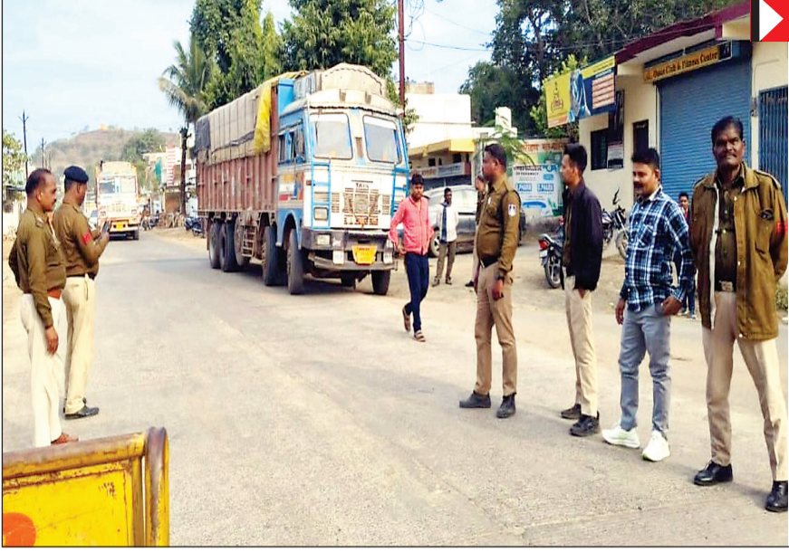
अभियान में शामिल पुलिस बल

पुलिस टीम ने सड़क से गुजर रहे दोपहिया और (चार पहिया) वाहनों को रोककर एक-एक कर उनकी गहन जांच की. इस दौरान,