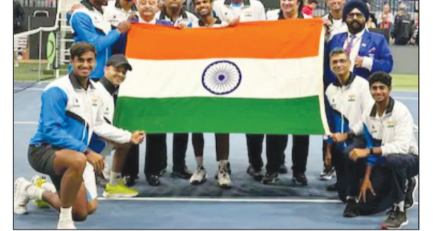
इंटरनेशनल टेनिस फेडरेशन (आईटीएफ) ने रविवार को घोषणा करते हुए कहा कि भारत फरवरी में डेविस कप 2026 क्वालिफायर में नीदरलैंड्स की मेजबानी करेगा। घरेलू मुकाबले के स्थानों के बारे में बाद में बताया जायेगा। पहले राउंड के टेनिस मुकाबले 6-7 या 7-8 फरवरी को खेले जाएंगे, जबकि दूसरे राउंड के मैच 18-19 या 19-20 सितंबर को होंगे हैं। भारत और नीदरलैंड्स क्वालिफायर में 27 टीमों में शामिल हैं, जिसमें से 13 विजेता टीमों, स्पेन के साथ, सितंबर के दूसरे राउंड में आगे बढ़ेंगे।

लंदन, 24 नवंबर भारत फरवरी में डेविस कप 226 क्वालिफायर में नीदरलैंड्स की मेजबानी करेगा।