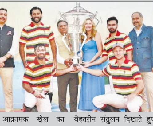
और आक्रामक खेल का बेहतरीन संतुलन दिखाते हुए

जयपुर, 24 नवंबर राजस्थान पोलो क्लब के मैदान पर रविवार को इतिहास रचते हुए जयपुर पोलो टीम ने कश्मीर चैलेंज कप अपने नाम कर