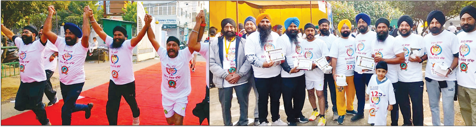
मैराथन गुरु तेग बहादुर मानवाधिकार मैराथन में दिखा उत्साह और ऊर्जा का संगम