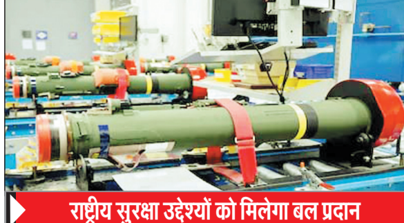
राष्ट्रीय सुरक्षा उद्देश्यों को मिलेगा बल प्रदान

विदेशों से सैन्य बिक्री को मंजूरी दी है। एजेंसी ने कांग्रेस को सूचित करते हुए आवश्यक प्रमाण प्रदान किया है। गौरतलब है कि भारत सरकार ने अमेरिका से 216 एम 982 ए 1 एक्सकेलिबर सामरिक प्रक्षेपास्त्रों की खरीद का अनुरोध किया है। इसमें शामिल की जाने वाली अतिरिक्त गैर-एमडीई वस्तुओं में पोर्टेबल इलेक्ट्रॉनिक फायर कंट्रोल सिस्टम, प्राइमर, अमेरिकी सरकार की तकनीकी सहायता, तकनीकी डेटा, व वापसी सेवाएं, और रसद एवं कार्यक्रम सहायता के अन्य संबंधित सामग्री शामिल हैं।