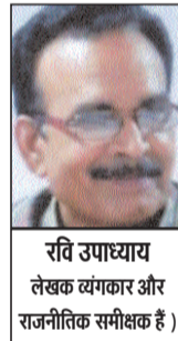
रवि उपाध्याय लेखक व्यंग्यकार और राजनीतिक समीक्षक हैं।