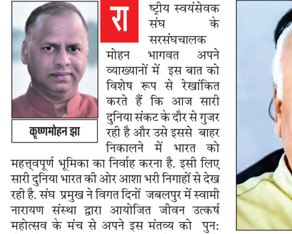
मोहन भागवत अपने व्याख्यानों में इस बात को विशेष रूप से रेखांकित करते हैं कि आज सारी दुनिया संस्कृत के दौर से गुजर रही है और उसे इससे बाहर निकालने में भारत को महत्वपूर्ण भूमिका का निर्वाह करना है. इसी लिए सारी दुनिया भारत की ओर आशा भरी निगाहों से देख रही है. संघ प्रमुख ने विगत दिनों जबलपुर में स्वामी नारायण संस्था द्वारा आयोजित जीवन उत्कर्ष महोत्सव के मंच से अपने इस संतव्य को पुनः दोहराते हुए कहा कि दुनिया भारत से यह अपेक्षा इसलिए रखती है क्योंकि भारत ने अपनी संस्कृति और आध्यात्मिकता की धरोहर को आज भी संजोकर रखा है और उसने हमेशा धर्म और संस्कृति के मार्ग का अनुसरण किया है. यही कारण है कि भारत ने समय समय पर दुनिया को सही मार्ग दिखाने का दायित्व निभाने में सफल हुआ है. भागवत ने कहा कि सामान्य भाषा में संस्कृति का अर्थ है संस्कार युक्त आचरण. एक दूसरे के प्रति सद्भावना और आत्मन्यता का भाव होने से समाज में सौहार्द बना रहता है अन्यथा शत्रुतापूर्ण संबंध होते हैं और झगड़े बढ़ते हैं.