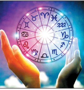
ज्योतिष हमें यह भी सिखाता है कि जीवन की हर घटना एक निश्चित समय पर घटती है, और प्रत्येक समय अपनी विशिष्ट ऊर्जा लेकर आता है। जब हम उस ऊर्जा के साथ तालमेल बनाते हैं, तब जीवन सरल और सफल होता है। यदि हम उसके विपरीत चलते हैं, तो संघर्ष बढ़ता है। अतः ज्योतिष हमें सही समय पर सही निर्णय लेना सिखाता है। यही कारण है कि इसे कालविद्या कहा गया है।

दृष्टि से ज्योतिष हमें बाहरी नहीं, बल्कि आंतरिक ब्रह्माण्ड की ओर ले जाता है। यह हमें यह सिखाता है कि जो आकाश में घट रहा है, वही हमारे भीतर भी घट रहा है; जो तारों की गति है, वही हमारे विचारों की गति है। वेदों में कहा गया है — यथा पिण्डे तथा ब्रह्माण्डे, इसका अर्थ है कि जिस प्रकार ब्रह्माण्ड में गति और संतुलन है, वही गति और संतुलन मनुष्य के शरीर और मन में भी विद्यमान है। जब हम अपने ग्रहों को समझते हैं, तो हम अपने भीतर के तत्वों — पृथ्वी, जल, अग्नि, वायु और आकाश — को भी समझते हैं। यही पंचमहाभूत मनुष्य और सृष्टि दोनों के आधार हैं। ज्योतिष इन्हीं तत्वों का अध्ययन कर यह दिखाता है कि मनुष्य का जीवन किस प्रकार प्रकृति की लय से जुड़ा हुआ है। मेरे अनुभव में, ज्योतिष केवल धर्म या परंपरा का विषय नहीं है, यह एक सार्थक विज्ञान है — जो गणित, भूगोल, दर्शन और मनोविज्ञान — सभी को एक सूत्र में बाँधता है। ग्रहों की गति गणितीय है, उनकी स्थिति भूगोलिक है, उनका अर्थ दार्शनिक है, और उनका प्रभाव मनोवैज्ञानिक है। इसीलिए मैं कहता हूँ कि ज्योतिष विज्ञान की आत्मा है, क्योंकि यह हमें यह सिखाता है कि विज्ञान और चेतना दोनों एक-दूसरे से अलग नहीं हैं।