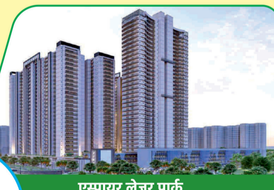
एस्पायर लेज़र पार्क