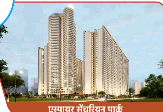
एस्पायर सेंचुरियन पार्क