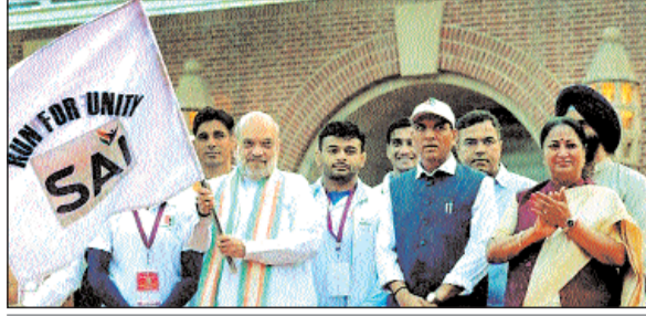
कृतज्ञ राष्ट्र की ओर से वंदन करता हूँ: शाह

लखनऊ. सीएम योगी आदित्यनाथ ने लखनऊ में योगी ने जारी 'युनिटी' का शुभारंभ किया। उन्होंने कहा कि भारत रत्न सरदार वल्लभभाई पटेल के जीवन से प्रेरणा लेकर हमें हर उस शक्ति का विरोध करना चाहिए जो राष्ट्र की एकता को कमजोर करने का प्रयास करती है। उन्होंने कहा कि भारत की अखंडता और एकता के लिए जिन्होंने अपना जीवन समर्पित किया। उन लौह पुरुष सरदार पटेल को सच्ची श्रद्धांजलि तभी होगी जब हम उनके आदर्शों को अपने आचरण में उतारें।