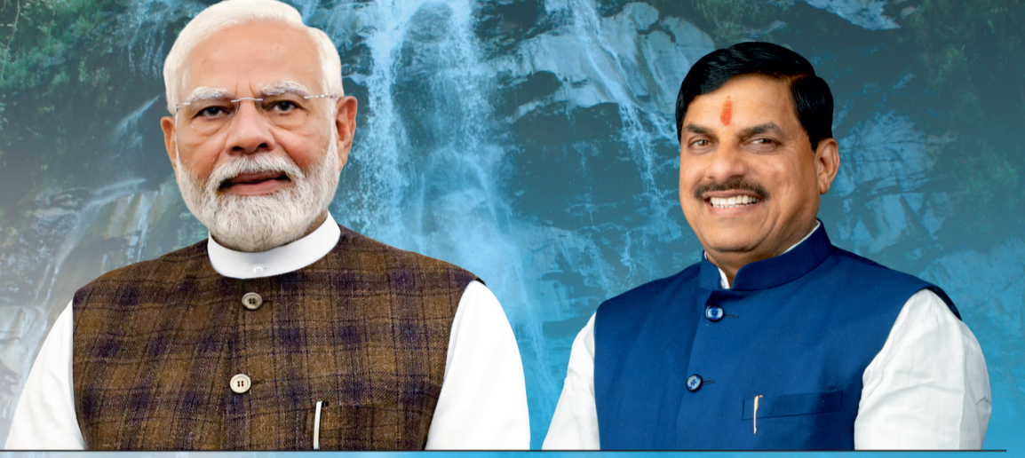
नरेन्द्र मोदी, प्रधानमंत्री