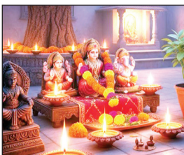
मंडला 17 अक्टूबर नभाप्र. सनातन धर्मावलंबी इस बार कार्तिक कृष्णपक्ष की त्रयोदशी तिथि आज शनिवार 18 अक्टूबर को धनतेरस का पर्व मनाएंगे।

शनिवार दोपहर 1.22 बजे से होगी। इस दिन ब्रह्म योग और शनि प्रदोष के साथ ही तुला राशि में सूर्य, बुध और मंगल का संचरण होने से त्रिग्रहीय संयोग बन रहा है। तुला राशि व्यापार की प्रतीक है और इसमें जगत की आत्मा सूर्य का संचरण हो रहा है, जो उद्योग, उत्थान और शक्ति के प्रतीक हैं। इन शुभ संयोगों से धनतेरस का महत्व बढ़ गया है। धनतेरस पर यम दीपदान भी होता है। इस दिन की गई खरीदी को अतिशुभ माना गया है। इस दिन चांदी, पीतल के बर्तन, चांदी के सिक्के, गणेश व लक्ष्मी की प्रतिमाएं खरीदा जाता है। कार्तिक कृष्ण पक्ष की त्रयोदशी को समुद्र मंथन के दौरान धनवंतरी अमृत कलश लेकर प्रकट हुए थे। इस दिन धनवंतरी जयंती मनाई जाती है। आयुर्वेद के विद्वान इस दिन धनवंतरी की प्रतिमा स्थापित कर पूजन करते हैं। इस दिन मछली के बर्तन की खरीदी को अति शुभ माना जाता है।