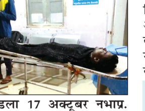
मंडला 17 अक्टूबर नभाप्र. विकासखंड बीजाडांडी के थाना क्षेत्र अंतर्गत ग्राम विजयपुर पिपरिया में शुक्रवार शाम एक स्टाप डेम में डूबने से 25 वर्षीय युवक को मृत्यु हो गई।