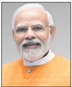
प्रधानमंत्री नरेंद्र मोदी

10 वर्ष पूर्व विजयदशमी के महापर्व पर राष्ट्रीय स्वयंसेवक संघ की स्थापना हुई थी। ये हजारों वर्षों से चली आ रही उस परंपरा का पुनर्स्थापन था, जिसमें राष्ट्र चेतना समग्र-समय पर उस युग की चुनौतियों का सामना करने के लिए, नए-नए अवसरों में प्रकट होती है। इस युग में संघ उसी अनादि राष्ट्र चेतना का पुण्य अवतार है। ये हमारी पीढ़ी के स्वयंसेवकों का सौभाग्य है कि हमें संघ के शताब्दी वर्ष जैसा महान अवसर देखने मिल रहा है। मैं इस अवसर पर राष्ट्रसेवा के संकल्प को समर्पित कोटि-कोटि स्वयंसेवकों को शुभकामनाएं देता हूँ। मैं संघ के संस्थापक, हम सभी के आदर्शगुरु पुरुष डॉक्टर हेडगेवार जी के चरणों में श्रद्धांजलि अर्पित करता हूँ। संघ की 100 वर्षों की इस गौरवमयी यात्रा को स्मृति में भारत सरकार ने विशेष डाक टिकट और स्मृति सिक्के भी जारी किए हैं।