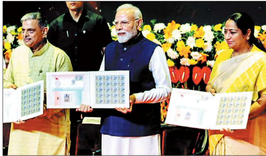
अनुभव कर रहा हूँ.

नई दिल्ली 1 अक्टूबर. प्रधानमंत्री नरेंद्र मोदी ने बुधवार को यहां राष्ट्रीय स्वयंसेवक संघ (आरएसएस) के शताब्दी वर्ष पूरे होने के अवसर पर विशेष रूप से डिजाइन किए गए डाक टिकट और 100 रुपये का स्मारक सिक्का जारी किया. राष्ट्रीय राजधानी के डॉ. अम्बेडकर अंतरराष्ट्रीय केंद्र में प्रधानमंत्री ने कहा कि केंद्र बलीराम हेडगेवार ने 1925 में नागपुर में संघ की स्थापना की. संघ अपने सामाजिक और सेवा कार्यों के लिए साथ शिक्षा, स्वास्थ्य, आपदा राहत, और सामाजिक सेवा में कई योगदान दिया है. आज जारी स्मारक टिकट और सिक्का इन्हीं योगदानों का प्रतीक है. उन्होंने संघ की 100 वर्षों की यात्रा को त्याग, निःस्वार्थ सेवा और राष्ट्र निर्माण की अद्भुत मिसाल बताया. कहा कि आरएसएस के शताब्दी समारोह का हिस्सा बनकर अत्यंत गौरवान्वित अनुभव कर रहा हूँ.