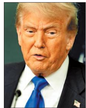
बिल के खिलाफ वोट किया. 100 सदस्यों वाली सीनेट में 53 रिपब्लिकन, 47 डेमोक्रेट और 2 निर्दलीय सांसद हैं. दोनों निर्दलियों ने बिल के समर्थन में वोटिंग की.

वॉशिंगटन, 1 अक्टूबर. अमेरिका में शटडाउन लागू हो गया है. राष्ट्रपति डोनाल्ड ट्रम्प सीनेट से फंडिंग बिल को पास नहीं करा पाए. इससे कई गैरजरूरी सरकारी कामकाज ठप हो गए हैं, जिससे करीब 9 लाख सरकारी कर्मचारियों को बिना सैलरी छुट्टी पर भेजने की नौबत आ गई है.