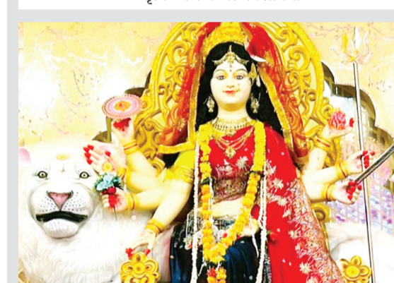
गांधी चौक की दुर्गा प्रतिमा