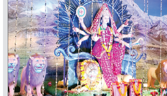
कृषि उपज मण्डों की प्रतिमा

करेली। साल में चार नवरात्रि आती है जिसमें से एक चेत्र नवरात्रि, दो गुप्त नवरात्रि और बारिश के बाद मूर्ति स्थापना की शारदीय नवरात्रि है। नगर भर में 18 से 20 दुर्गा पंडालों में अलौकिक माता की दुर्गा प्रतिमाएं विराजमान की गई हैं जिसमें से शारदा मंदिर के पास आजाद बंधु मंडल पंडाल में दुर्गा माता के तीन स्वरूपों में प्रतिमाएं विराजमान की गई हैं। मां अंबे, मां लक्ष्मी, मां सरस्वती अपने सिर पर जवारों रखे हुये हैं। मंडल ने माता का स्वरूप जवारों रखकर ले जाते का दिखाया है। तीनों माता जवारों को लेकर अपने लोक जा रही हैं और माता का वाहन शेर तबला साज बजाकर आगे आगे चल रहा है।