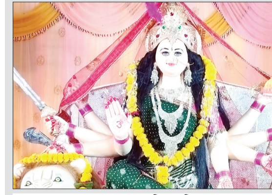
नायक मुहल्ला स्थित प्रतिमा