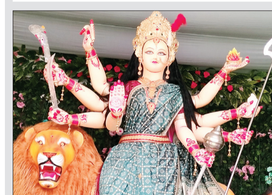
नगरिया मंदिर की दुर्गा प्रतिमा