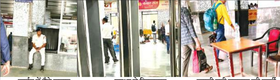
फुर्सत में बैठे जवान