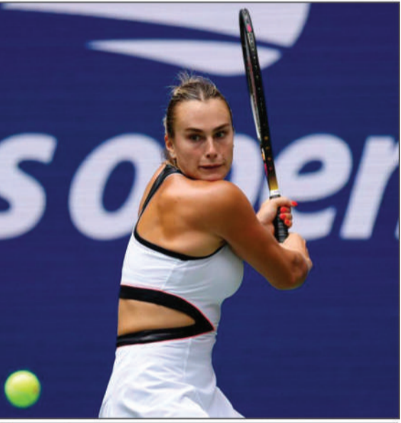
अगले दौर में कुदेरमेटोवा से मुकाबला