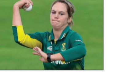
कितना मिस किया है और मैं एक बार फिर उस अवसर को पाने के लिए अपना सबकुछ देने के लिए पूरी तरह प्रतिक्रम हूँ। दक्षिण अफ्रीका महिला टीम का राष्ट्रीय प्रशिक्षण शिविर 25 अगस्त से डरबन में शुरू होगा और सितंबर तक चलेगा।

केपटाउन, 25 अगस्त (वार्ता) आगामी एकदिवसीय महिला विश्वकप से पहले संन्यास ले चुकी दक्षिण अफ्रीका की दिग्गज खिलाड़ी और पूर्व कप्तान डेन वैन नीकेर्क की 20 सदस्यीय टीम में शामिल किया गया है। अंतरराष्ट्रीय क्रिकेट से संन्यास 2023 में संन्यास ले चुकी डेन वैन नीकेर्क ने अपने सोशल मीडिया अकाउंट पर एक बयान में लिखा, मुझे यह घोषणा करते हुए बेहद खुशी हो रही है कि मैंने अंतरराष्ट्रीय क्रिकेट से संन्यास लेने के फैसला को वापस ले लिया है। इस समय ने मुझे याद दिलाया है कि मैंने अपने देश का प्रतिनिधित्व करना