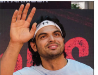
प्रतियोगिता 28 अगस्त को होगी. नीरज चोपड़ा का इवेंट स्थानीय समय के अनुसार शाम 7:45 बजे (भारतीय समयानुसार गुरुवार रात 11:15 बजे) शुरू होगा.

नई दिल्ली 25 अगस्त. डायमंड लीग फाइनल के लिए एंटी लिस्ट जारी कर दी गई है, जिसमें भारत के दो बार के ओलंपिक पदक विजेता नीरज चोपड़ा के साथ-साथ नोआ लाइन्स, जूलियन अल्फ्रेड और मॉडो डुप्लांटिस जैसे सुपरस्टार खिलाड़ी शामिल हैं. यह प्रतिष्ठित प्रतियोगिता 27 और 28 अगस्त को ज्यूरिख में होगी, जहां दो दिनों तक कड़ी प्रतिद्वंद्विता, रिकॉर्ड तोड़ने की कोशिश और रोमांचक दौड़ देखने को मिलेगी. भारतीय एथलेटिक्स प्रशंसकों के लिए सबसे बड़ा आकर्षण नीरज चोपड़ा का प्रदर्शन होगा. पुरुषों की भाला फेंक