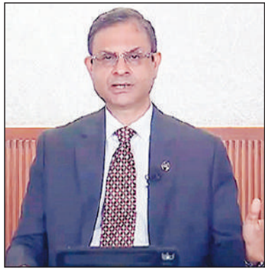
पर जोर दिया।

अमेरिकी टैरिफ से भारत पर न्यूनतम असर की उम्मीद