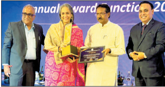
आजीवन उपलब्धि पुरस्कार भी प्रदान किए गए