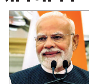
हाईकोर्ट का फैसला

साल 2016 में सीआईसी ने 1978 में बीए पास करने वाले छात्रों के रिकॉर्ड की जांच को अनुमति दी थी, जिसमें पीएम मोदी का नाम भी शामिल माना गया था. दिल्ली विश्वविद्यालय ने इस आदेश को चुनौती दी थी. सुनवाई के दौरान विश्वविद्यालय की ओर से सॉलिसिटर जनरल तुषार मेहता ने तर्क दिया कि निजता का अधिकार जानने के