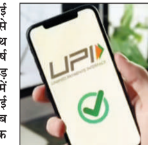
कुल वैल्यू ट्रांज़ैक्शन में पीयर-टू-मर्चेंट (पी2एम) ट्रांज़ैक्शन को

जनवरी से अगस्त तक एवरेज डेली वैल्यू 75,743 करोड़ से बढ़कर 90,446 करोड़ नई दिल्ली, 2 अगस्त. यूपीआई ट्रांज़ैक्शन में लगातार तेजी से वृद्धि हो रही है. इसी के साथ एवरेज डेली वैल्यू इस वर्ष जनवरी के 75,743 करोड़ रुपए से बढ़कर अगस्त में 9,446 करोड़ रुपए दर्ज की गई है, जिसमें एसबीआई 5.2 अरब ट्रांज़ैक्शन के साथ शीर्ष प्रेषक सदस्य रहा. यह जानकारी सोमवार को आई एक रिपोर्ट में दी गई. एसबीआई रिसर्च के अनुसार, अकेले जुलाई में 9.8 प्रतिशत हिस्सेदारी के साथ महाराष्ट्र डिजिटल पेमेंट में अग्रणी रहा, उसके बाद 5.5 प्रतिशत के साथ कर्नाटक और 5.3 प्रतिशत हिस्सेदारी के साथ उत्तर प्रदेश का स्थान रहा. रिपोर्ट में कहा गया है,