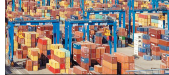
डॉलर का व्यापार घाटा चिंताजनक है. आर्थिक शोध संस्थान जीटीआरआई ने बुधवार को यह बात कही. ग्लोबल ट्रेड रिसर्च इनिशिएटिव (जीटीआरआई) ने कहा कि 2014 से 2024 के बीच

नयी दिल्ली, 2 अगस्त. भारत को दुर्लभ खनिजों और उर्वरकों के निर्यात पर पाबंदियों में डील देने का चीन का फैसला एक सकारात्मक संकेत है. हालांकि भारत को पड़ोसी देश पर अपनी निर्भरता कम करने के लिए काम करना चाहिए जिसके साथ उसका 1 अरब अमेरिकी