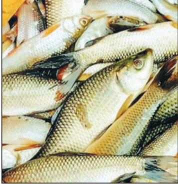
नवाचार जलवायु-सहिष्णु कृषि कार्यक्रम के तहत असम, पश्चिम बंगाल, बिहार, ओडिशा और केरल में आर्द्रभूमि मत्स्यपालन पर अध्ययन किए जा रहे हैं. समुद्री क्षेत्र में जलवायु परिवर्तन मॉडलिंग, मछली पकड़ने के अनुमान, समुद्री खेती, महासागर

नई दिल्ली, 21 अगस्त. भारत में समुद्री मछली उत्पादन में उल्लेखनीय वृद्धि दर्ज की गई है. 22-21 में जहाँ उत्पादन 34.76 लाख टन था, वहीं 223-24 में यह बढ़कर 44.95 लाख टन हो गया. औसतन वार्षिक वृद्धि दर 8.9 प्रतिशत रही. यह जानकारी मत्स्य पालन, पशुपालन एवं डेयरी राज्य मंत्री जॉर्ज कुरियन ने बुधवार को संसद में दी. भारतीय कृषि अनुसंधान परिषद के अंतर्गत केंद्रीय समुद्री मत्स्य अनुसंधान संस्थान की रिपोर्ट के अनुसार, 2022 में आंके गए 135 समुद्री मछली संसाधनों में से 91.1 प्रतिशत सतत पाए गए. आईसीएआर के विभिन्न अनुसंधान संस्थान जलवायु परिवर्तन के प्रभावों का आकलन कर रहे हैं और जलवायु-सहिष्णु मत्स्य एवं जलीय कृषि रणनीतियाँ विकसित कर रहे हैं. राष्ट्रीय