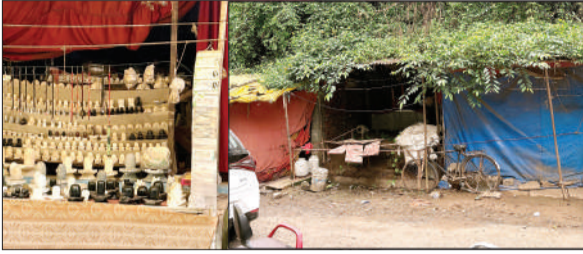
जीवन यापन करते हैं।