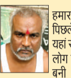
हमारा परिवार पिछले 80 वर्षों से यहां रह रहा है। हम लोग संगमरमर से बनी भगवान की मूर्तियों को बेचकर जीवन यापन करते हैं।