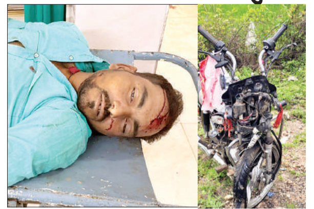
पड़रिया मोड़ के पास एक्सीडेंट हो गया जिसमें उसे गंभीर रूप से चोटें आ गईं परिजनों द्वारा उसे शासकीय अस्पताल सिहोरा ले जाया गया जहां डॉक्टर ने परीक्षण उपरांत उसे मृत अवस्था घोषित कर दिया। सूचना पर पहुंची पुलिस ने पंचनामा कार्यवाही कर शव का पीएम के लिए भिजवाते