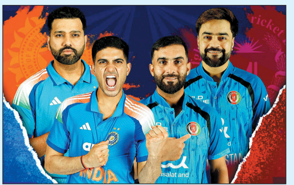
थी. मेहमान टीम उस व्यक्तिगत शानदार प्रदर्शन से आत्मविश्वास तो लेगी, लेकिन एक मजबूत भारतीय टीम को चुनौती देने के लिए उन्हें कहीं ज्यादा सामूहिक प्रयास की जरूरत होगी। पहले तनडे में दोनों टीमों के बीच कुल क्षमता का अंतर साफ दिखेगा।

लखनऊ, 16 जून भारत बुधवार को लखनऊ के भारत रत्न श्री अटल बिहारी वाजपेयी एकाना क्रिकेट स्टेडियम में अफगानिस्तान के खिलाफ दूसरे तनडे में तीन मैचों की सीरीज जीतने की कोशिश करेगा। पहले मैच में शानदार जीत के बाद भारत 1-0 से आगे है। वहीं, अफगानिस्तान के लिए सीरीज में बने रहने के लिए यह मैच जीतना जरूरी है। पहले तनडे में रहमानुल्लाह गुरबाज के शानदार शतक के बावजूद उनकी टीम की बल्लेबाजी लड़खड़ा गई