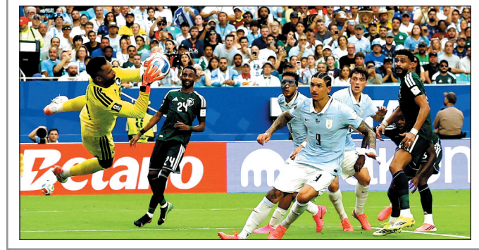
2-2 की रोमांचक बराबरी पर समाप्त हुआ, दोनों टीमों ने अपने आक्रामक खेल और जिसे दिन का सबसे मनोरंजक मैच माना गया।