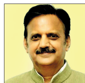
7.63 लाख बालिकाओं का हुआ टीकाकरण

उन्होंने अभियान से जुड़े चिकित्सकों, नर्सिंग स्टाफ, आशा एवं आंगनवाड़ी कार्यकर्ताओं, एएनएम, शिक्षकों, जिला प्रशासन तथा स्वास्थ्य विभाग के सभी अधिकारियों-कर्मचारियों के