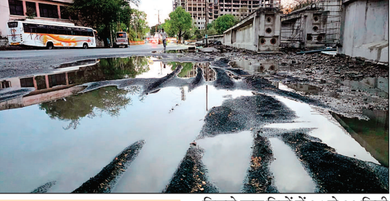
► गर्मी से मिला राहत, शुरू हुई बिजली की तुकाटुपी

उज्जैन। मानसून के केरल में दस्तक देने के बाद उत्तर भारत का मौसम बदल गया है। गुरुवार शुक्रवार रात हुई बारिश के बाद दिन रात के तापमान में गिरावट दर्ज की गई है। मौसम विभाग ने प्री मानसून की एक्टिविटी होना बताया है और दो-तीन दिन तक किसी तरह का मौसम बना रहने की बात कही है। इस बार केरल में मानसून तीन दिनों की देरी से पहुंचा है जो तेजी से आगे बढ़ता दिखाई दे रहा है। जिसके चलते उत्तर भारत में प्री मानसून की गतिविधियां बढ़ गई हैं। जैसे शहर में पिछले दो-तीन दिनों से तेज आंधी और बारिश का सिलसिला बना हुआ था जो गुरुवार शुक्रवार रात में एक बार फिर दिखाई दिया। 3 बजे के लगभग तेज हवा के बारिश शुरू हुई। जो रुक-रुक कर सुबह तक जारी रही। तेज हवा और बारिश की वजह से न्यूनतम तापमान में 4.5 डिग्री की गिरावट दर्ज की गई न्यूनतम तापमान 21 डिग्री दर्ज हुआ है। जो