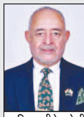
एडमिरल डीके जोशी