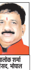
आलोक शर्मा सांसद, भोपाल

आज भोपाल अपनी आजादी की 77वीं वर्षगांठ 'भोपाल गौरव दिवस' के रूप में मना रहा है. भोपाल की जनता और विशेष तौर पर युवा पीढ़ी को यह जानना बहुत