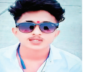
कॉलेज में बीए प्रथम वर्ष का छात्र था. वह करीब एक महीने पहले भंवरकुआं क्षेत्र स्थित एक हॉस्टल