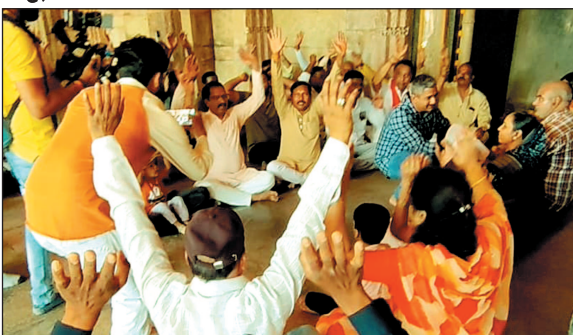
व्यवस्था बनाए रखने के लिए अलर्ट मोड पर रहा. गौरतलब है कि इंदौर हाई कोर्ट ने शुरूवार को एएसआई सर्वे रिपोर्ट और