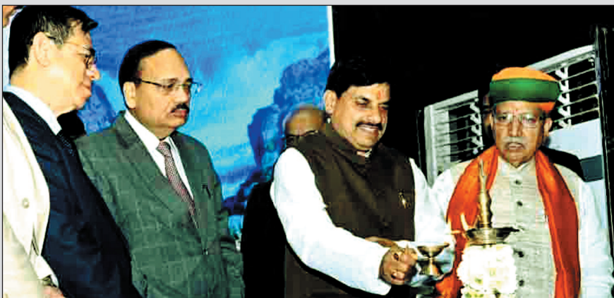
अर्जुन राम मेघवाल भी मौजूद थे. जबलपुर में 'फ्रगमेंटेशन टू

नेताजी सुभाषचंद्र बोस कल्चरल एंड इन्फर्मेशन सेंटर में आयोजित कार्यक्रम में सुप्रीम कोर्ट के 9 जज, मध्य प्रदेश हाईकोर्ट के चीफ जस्टिस संजीव सचदेवा, मुख्यमंत्री डॉ. मोहन यादव और केंद्रीय कानून मंत्री