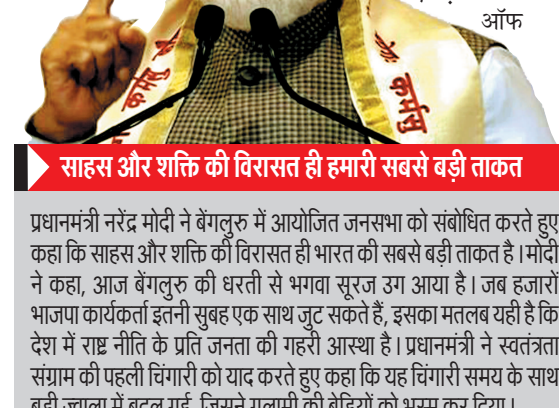
साहस और शक्ति की विरासत ही हमारी सबसे बड़ी ताकत

डिजिटल का हमें कम उपयोग करने होंगे. साथ ही उन्होंने कहा कि डिजिटल क्रांति ने भारत को वैश्विक आधार बताया. पीएम ने तेलंगाना के सीएम के. चंद्रशेखर रेड्डी को सुझाव देते हुए कहा कि अच्छा है मेरे से ही जुड़ें. वहीं, उन्होंने बताया कि बंगलुरु में 250 एकड़ में फैला आर्ट ऑफ