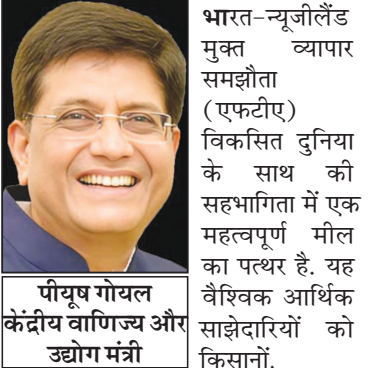
पीयूष गोयल, केंद्रीय वाणिज्य और उद्योग मंत्री

भारत-न्यूजीलैंड मुक्त व्यापार समझौता (एफटीए) विकसित दुनिया के साथ की सहभागिता में एक महत्वपूर्ण मील का पत्थर है। यह वैश्विक आर्थिक साझेदारियों को किसानों, महिलाओं, युवाओं और रोजगार सृजक उद्योगों के लिए ठोस लाभ में बदलने से जुड़े प्रधानमंत्री नरेंद्र मोदी के दृष्टिकोण में हुई निर्णायक प्रगति को प्रतिबिंबित करता है। यह एफटीए प्रमुख विकसित अर्थव्यवस्थाओं, जिसमें यूनाइटेड किंगडम और यूरोपीय संघ शामिल हैं, के साथ हुए कई ऐतिहासिक व्यापार समझौतों के बाद हो रहा है। ये समझौते वैश्विक बाजारों में भारत की स्थिति को मजबूत करते हैं और निर्यातकों को दुनिया की कुछ सबसे लाभकारी अर्थव्यवस्थाओं में, यहां तक कि वर्तमान वैश्विक अनिश्चितता और उथल-पुथल के बीच भी प्रतिस्पर्धा आधारित बढ़त प्रदान करते हैं। निर्यात और रोजगार को मजबूत बढ़ावा: दोनों पक्षों के लिए समान रूप से