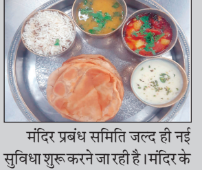
मंदिर प्रबंध समिति जल्द ही नई सुविधा शुरू करने जा रही है। मंदिर के

उज्जैन। महाकाल मंदिर में श्रद्धालु अब भगवान को रोज सुबह होने वाली भोग आरती में अपनी ओर से भोग लगा सकेंगे। इसके लिए मंदिर प्रबंध समिति के निःशुल्क अन्नक्षेत्र में दान देना होगा। दान देने वालों को इस सुविधा का लाभ मिलेगा। दान भी ऑनलाइन लिया जाएगा।