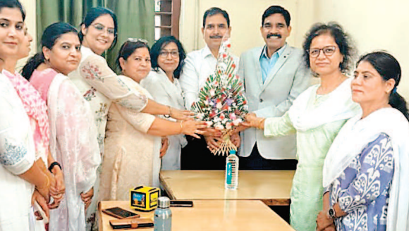
करते हुए कामकाज की गति और गुणवत्ता पर जोर दिया. साथ ही प्रशिक्षण के जरिए खुद को अपडेट रखने की जरूरत भी बताई. आईगाँट प्लेटफॉर्म पर 2 से 10 अप्रैल तक चले साधना

इंदौर. अभियोजन संचालनालय में आयोजित कार्यक्रम में ऑनलाइन प्रशिक्षण में बेहतर प्रदर्शन करने वाले अधिकारियों को सम्मानित किया गया. कार्यक्रम में प्रशासनिक स्तर पर सक्रियता और प्रशिक्षण के प्रति रुचि भी साफ नजर आई. भोपाल से आए प्रभारी संयुक्त संचालक के आगमन पर जिला न्यायालय स्थित कार्यालय में उनका स्वागत किया गया. उन्होंने अधिकारियों से सीधे संवाद