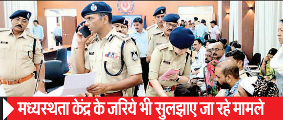
मध्यस्थता केंद्र के जरिये भी सुलझाए जा रहे मामले

इंदौर. प्रति मंगलवार को आयोजित जनसुनवाई में 28 अप्रैल को 85 शिकायतें सामने आईं. पुलिस कमिश्नर ने सभी आवेदकों की समस्याएं सुनकर संबंधित अधिकारियों को तत्काल कार्रवाई और शीघ्र निराकरण के निर्देश दिए. मध्यप्रदेश शासन के निर्देश पर हर मंगलवार को जनसुनवाई आयोजित की जा रही है. जिसके तहत 28 अप्रैल को कमिश्नर कार्यालय में आयोजित जनसुनवाई में बड़ी संख्या में लोग अपनी शिकायतें लेकर पहुंचे. प्राप्त आवेदनों में पारिवारिक विवाद, आपसी झगड़े, पैसों का लेन देन, फाइनेंशियल फ्रॉड, जमीन लाट धोखाधड़ी, महिला अपराध और