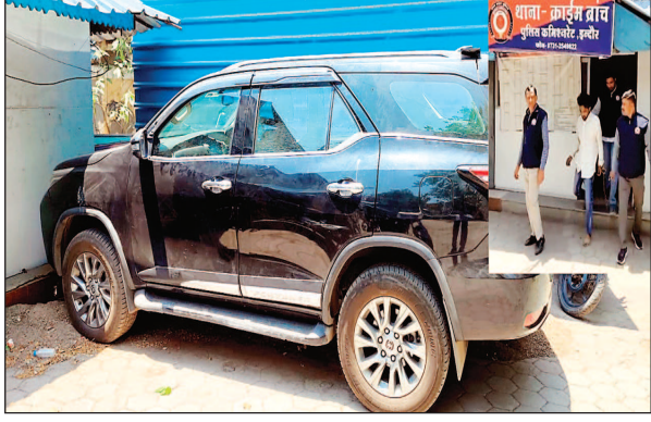
का माल जब्त किया है. शहर में अवैध मादक पदार्थों के खिलाफ चलाए जा रहे अभियान के तहत क्राइम ब्रांच लगातार कार्रवाई कर रही है. इसी दौरान टीम को शिवालय रोड क्षेत्र में एक फॉर्च्यूनर कार में बैठा संदिग्ध युवक नजर आया.

इंदौर. क्राइम ब्रांच ने एक आरोपी को 11.12 ग्राम एमडी ड्रग्स के साथ गिरफ्तार किया है. आरोपी फॉर्च्यूनर कार से तस्करी करता था. पुलिस ने फॉर्च्यूनर कार से मोबाइल और डिजिटल तोल मशीन सहित करीब 42 लाख रुपए