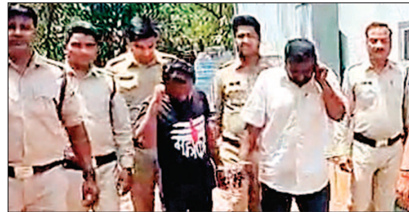
इंदौर. खजराना क्षेत्र में पुलिस ने नशे के खिलाफ बड़ी कार्रवाई करते हुए दो आरोपियों को एमडी ड्रग्स के साथ गिरफ्तार किया है. दोनों के कब्जे से 10 ग्राम से अधिक मादक पदार्थ एमडी ड्रग्स और एक ऑटो रिक्शा सहित करीब 4 लाख रुपए का माल जब्त किया है. जौरो टॉलरेंस अभियान के तहत खजराना पुलिस ने विशेष टीम बनाकर यह कार्रवाई की. टीम को रंगून गार्डन, स्क्रीम नंबर 134 के पास दो संदिग्ध युवक ऑटो पर बैठे दिखे. पुलिस को देखते ही दोनों भागने लगे, जिन्हें घेराबंदी कर पकड़ लिया.