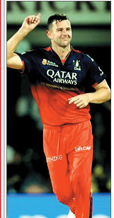
जोश हेजलवुड ने नई गेंद से कहर बरपाते हुए 12 रन देकर निकाले 4 विकेट

विराट कोहली आईपीएल में 9000 रन पूरे करने वाले पहले बल्लेबाज बने