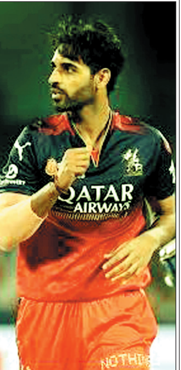
भारतीय तेज गेंदबाज भुवनेश्वर ने शानदार गेंदबाजी कर झपटे 3 विकेट

नई दिल्ली, 27 अप्रैल. इंडियन प्रीमियर लीग 2026 के मुकाबले में रॉयल चैलेंजर्स बंगलुरु ने दिल्ली कैपिटल्स को 9 विकेट से हराते हुए शानदार जीत दर्ज की. नई दिल्ली के अरुण जेटली स्टेडियम में खेले गए इस मैच में दिल्ली की टीम पहले बल्लेबाजी करते हुए महज 75 रन पर सिमट गई. जवाब में बंगलुरु ने 6.3 ओवर में एक विकेट खोकर 77 रन बनाते हुए मुकाबले को पूरी तरह एकतरफा बना दिया. टॉस हारकर बल्लेबाजी करने उतरी दिल्ली कैपिटल्स की शुरुआत बेहद निराशाजनक रही. टीम ने पावरप्ले में ही अपने छह विकेट गंवा दिए और सिर्फ 13 रन बना सकी, जो आईपीएल इतिहास में शुरुआती छह ओवरों का सबसे कम स्कोर है. शुरुआती झटकों के बाद टीम संभल नहीं पाई और लगातार अंतराल पर विकेट गिरते रहे. मध्यक्रम में डेविड मिलर और अभिषेक पोरेल ने कुछ हद तक पारी संभालने की कोशिश की, लेकिन यह प्रयास ज्यादा देर तक टिक नहीं पाया. मिलर 19 रन बनाकर आउट हुए, जबकि अन्य बल्लेबाज भी बड़ी पारी खेलने में नाकाम रहे. अंततः पूरी टीम 16.3 ओवर में 75 रन पर सिमट गई. दिल्ली की इस खराब बल्लेबाजी के पीछे बंगलुरु के