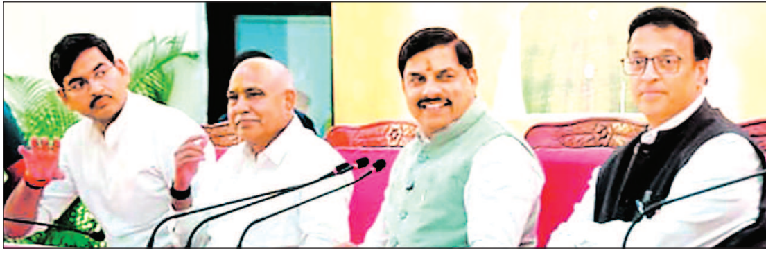
भोपाल, 22 अप्रैल. मुख्यमंत्री डॉ मोहन यादव ने किसानों को कृषि भूमि के

सीएम ने मीडिया से कहा- अब बड़ी परियोजनाओं को गति मिलेगी और किसान भी होंगे लाभान्वित